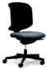
434-3219 Netzrücken Komfort