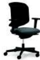
434-7219 Netzrücken Komfort

Langlebige Qualität. Mit seiner robusten Bauweise garantiert der giroflex 434 Qualität und Langlebigkeit. Er verfügt über eine mittelhohe Rückenlehne und alle nötigen Verstellmöglichkeiten für komfortables Sitzen, optional mit verstellbarer Lordosenstütze. Neben verschiedenen Bezugsmaterialien für den Sitz stehen eine Netz- und eine Netzpolstervariante zur Auswahl. Der 5-Sternfuss ist in poliertem Aluminium, in Schwarz und in weiteren Farbtönen erhältlich.